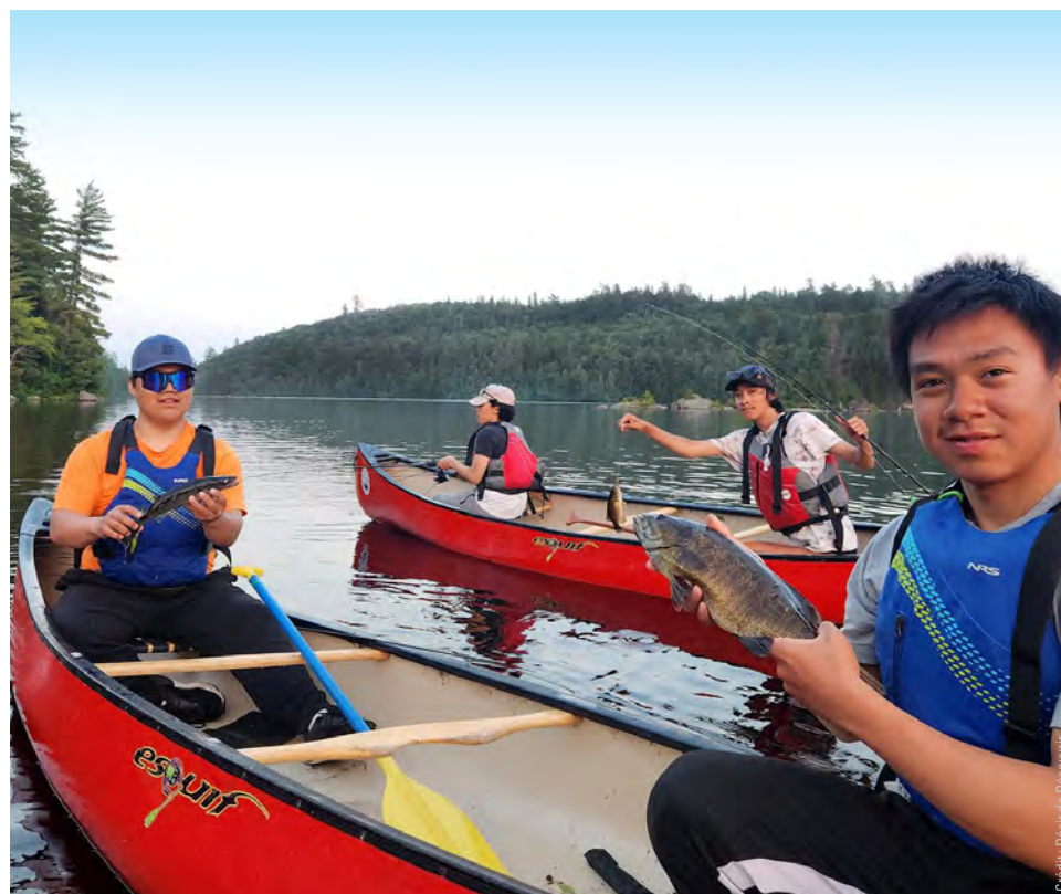
Les différentes façons de faire des Nunavummiut et des Québécois dans la nature auront donné lieu à de riches échanges entre les deux cultures.

Puis, une équipe de direction, qui comprenait un leader expérimenté dans le travail avec les jeunes et un travailleur en santé mentale, a été fournie.