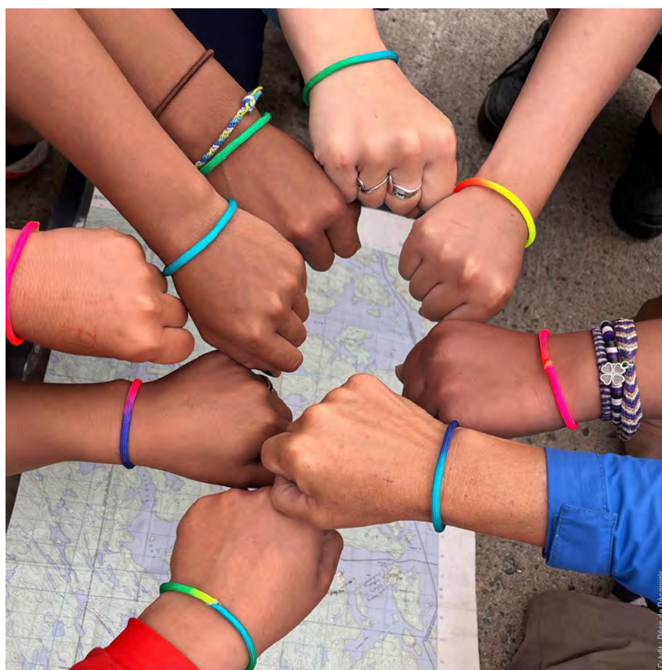
Les 13 jeunes Inuit ont passé deux semaines en canot-camping au Lac Kipawa, dans la région du Témiscamingue au Québec.